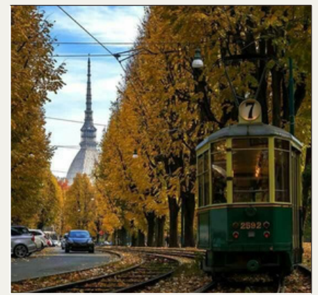
Torino, ITALIA 17:30-18:00