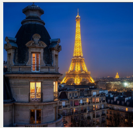
París, FRANCIA 17:10-17:30