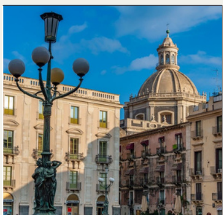
Catania, ITALIA 18:00-18:20