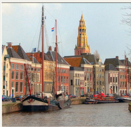
Groningen, PAÍSES BAJOS 16:00-16:20