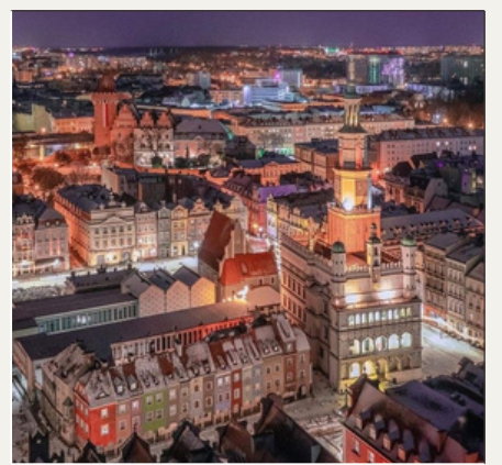
Poznan, POLONIA 12:30-13:00