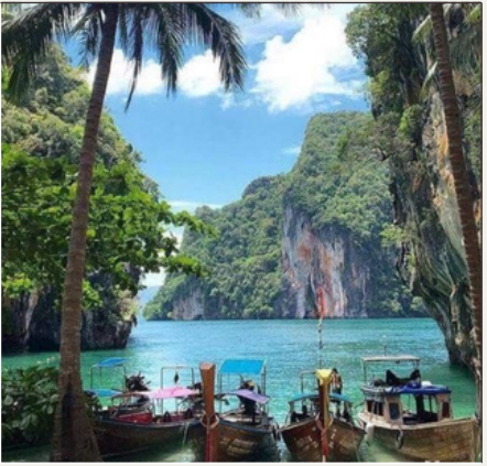
Becas del convenio, ASIA Y AMÉRICA LATINA 11:30-12:00