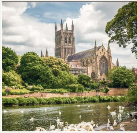
Birmingham, REINO UNIDO 10:30-11:00