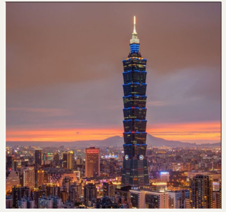
Taipéi, TAIWÁN 11:00-11:30