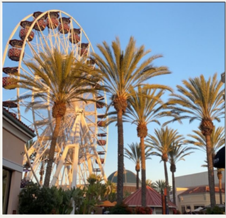
Irvine, CALIFORNIA 10:00-10:30