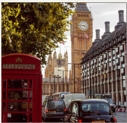
Londres, REINO UNIDO 13:00-13:30