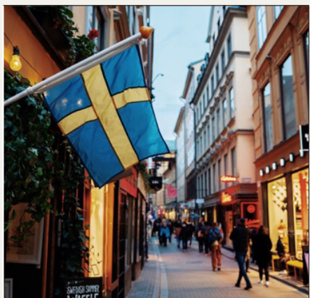
Örebro, SUECIA 16:40-17:10