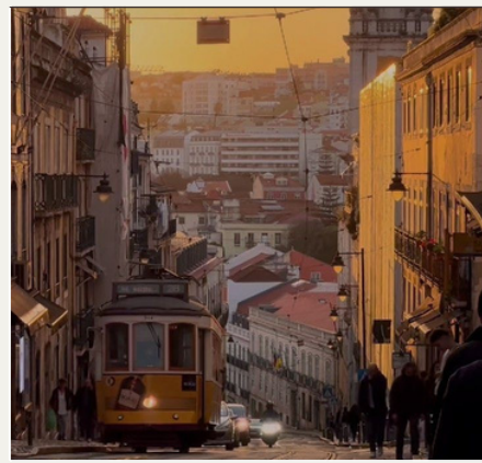
Lisboa, PORTUGAL 18:20-18:40