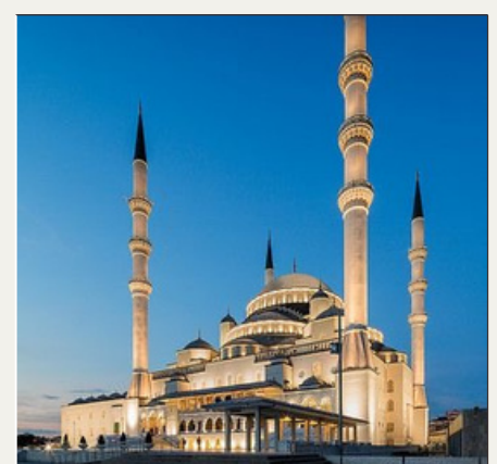
Ankara, TURQUÍA 16:20-16:40